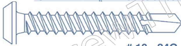
# 10 - 24G